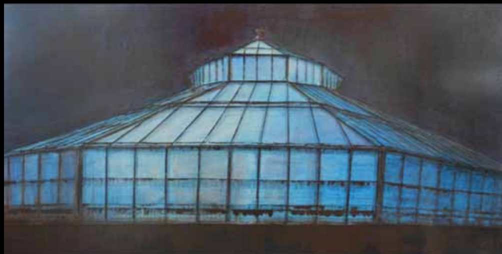
BELLE DE NUIT, 120 x 60 cm, technique mixte

Tissu végétal imprégné de lumière, cellules jointives en harmonie.