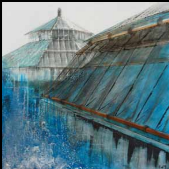
LIMPIDITÉ, 100 x 100 cm, technique mixte

Horizontalité ou verticalité, nuit ou jour ? Opposition clair-obscur.