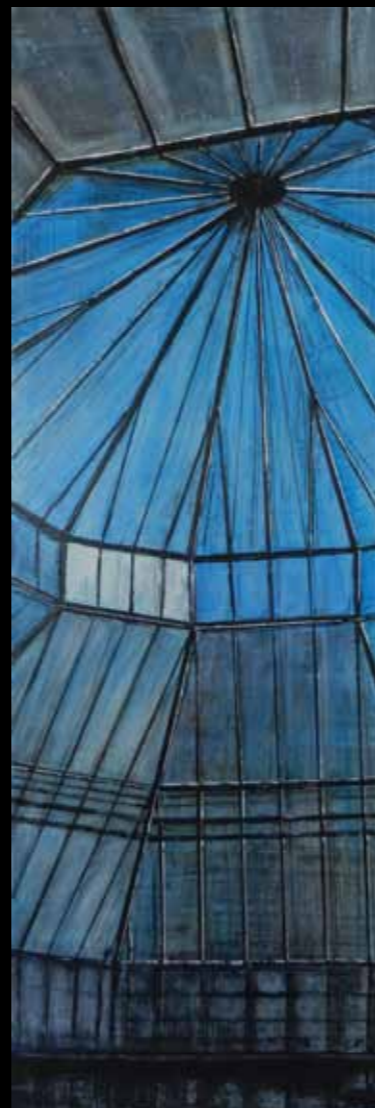
FRAGILITÉ, 120 x 40 cm, t. mixte

Monde aquatique, monde terrestre. Eau et lumière, sources de vie.