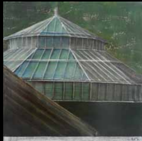
L'ORIENTALE, 50 x 50 cm, technique mixte

Cathédrale de verre, de pierre et d'acier, cathédrale de clarté.