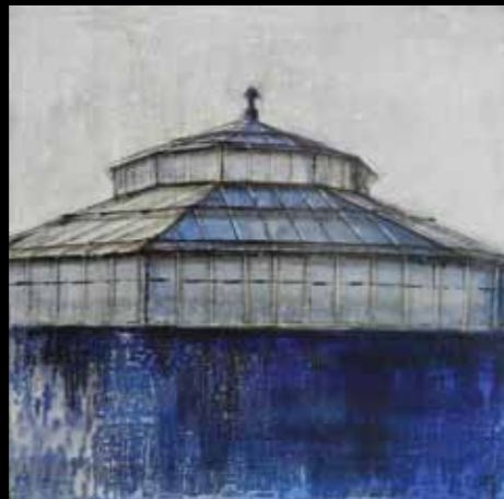
L'ENVOL, 50 x 50 cm, technique mixte

Écrin de verre, écrin de lumière, écrin de vie.