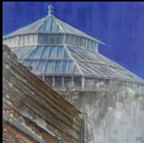
AMBIANCE HIVERNALE, 80 x 80 cm, t. mixte

Écrin de verre, écrin de lumière, écrin de vie.