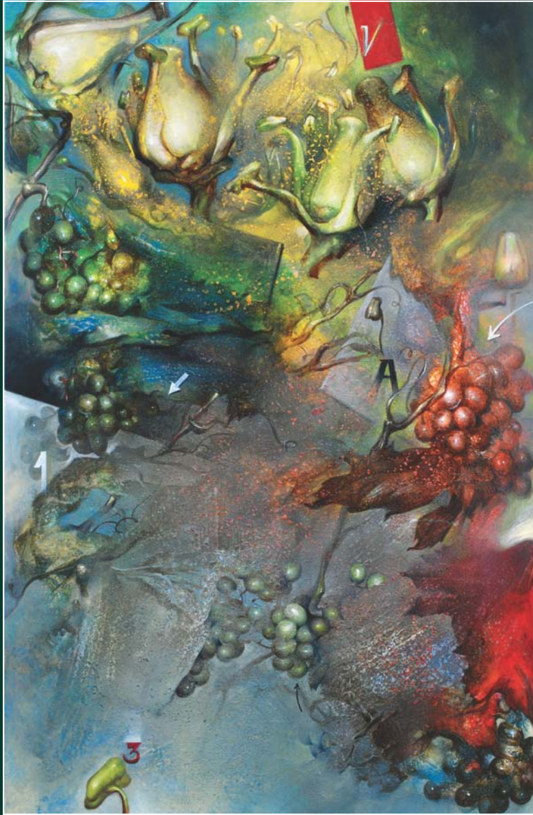
Jaime OLIVARES - (199, 100x100) -huile sur toile - 100 x 80 cm - 2013